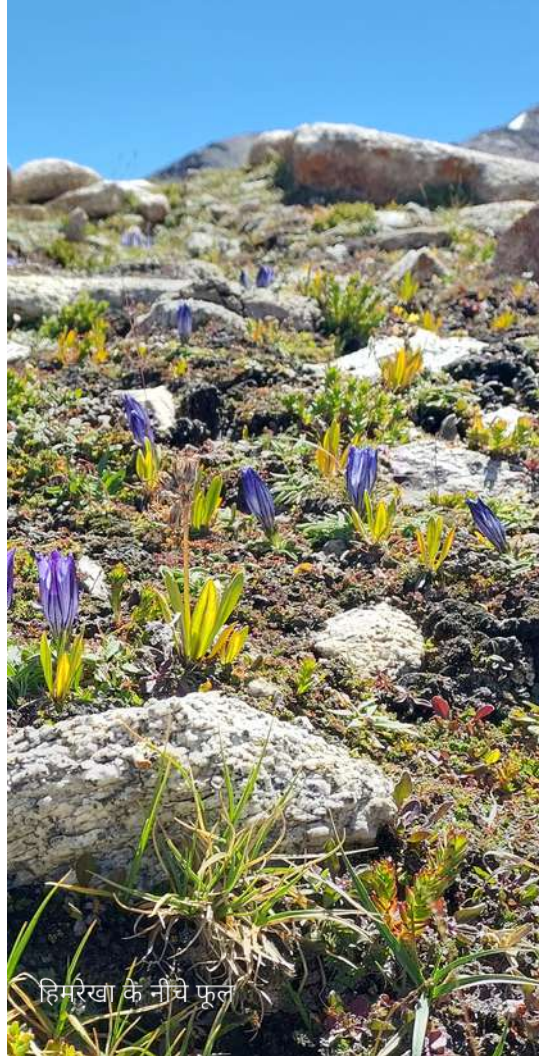
हिमरेखा के नीचे फूल