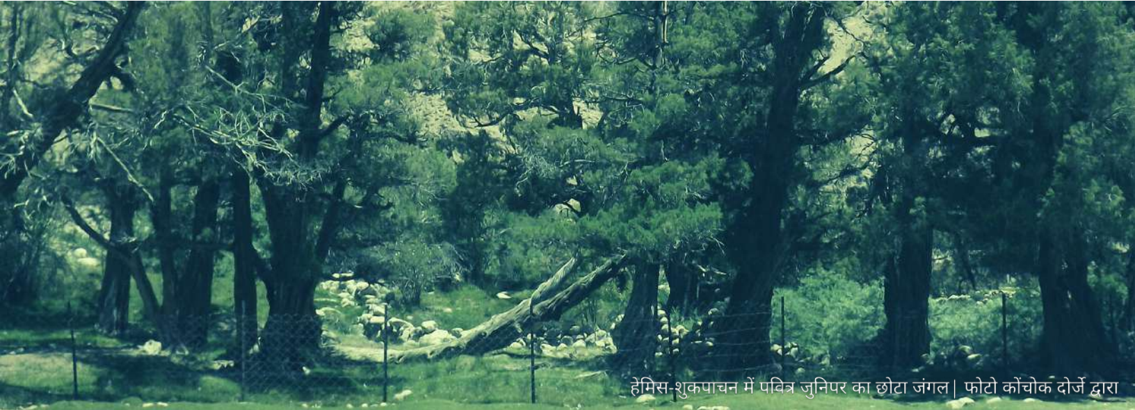
हेमिस-शुकपाचन में पवित्र जूनिपर का छोटा जंगल

बड़े पहाड़ों के जड़ों के किनारे पालु (सुगंधित पौधा) की खोज में गए बड़े पहाड़ों के जड़ों के किनारे यालु (एक पौधा) की खोज में गए पालु और यालु नहीं मिल सके भगवान जूनिपर का पेड़ प्रकट हुआ वृक्षों, जूनिपर के सुगंधित धुएँ भगवान के ऊपरी जगत (स्वर्ग) में फैल गई वृक्षों, जूनिपर के सुगंधित धुएँ भूमि के नीचे भगवान के पास पहुंच गई वृक्षों, जूनिपर के सुगंधित धुएँ मध्य जगत (पृथ्वी) में फैल गई