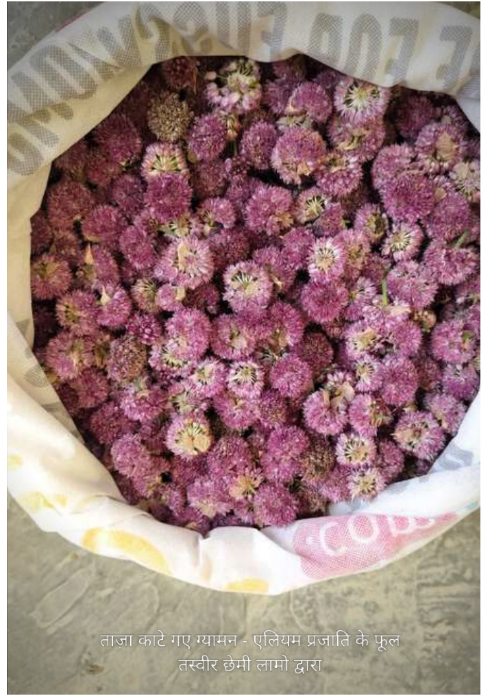
ताज़ा काटे गए ग्यामन - एलियम प्रजाति के फूल

फोलोलिंग की पत्तियों को पीसकर चटनी बनती है और दही में भी स्वाद के लिए मिलाकर खाया जाता है, जबकि शलमागो की पत्तियों को दही या छाछ में मिलाकर तंगथुर तैयार किया जाता है। स्रोलो-मार्पो और स्रोलो-सर्पो के नरम अंकुरों को बहती जल धारा में अच्छे से धोकर दही में मिलाकर श्रोलो-तंगथुर तैयार किया जाता है।