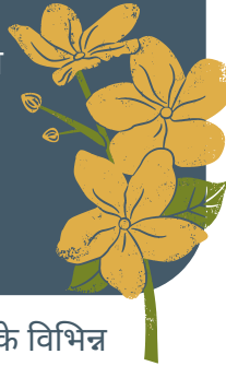
कोष्ठक 1: लद्दाख के उच्च हिमालयी क्षेत्र के विभिन्न प्राकृतिक स्थान

ज़मीन के नीचे उनकी जड़ों का घना झुण्ड होता है जो कि प्रकाश संश्लेषक उत्पाद, फोटोसिंथेसिस, से प्राप्त भोजन (कार्बोहायड्रेट) का सर्दियों के लम्बे समय के लिए संग्रहण करता है, जब कि पौधों के पास फोटोसिंथेसिस प्रक्रिया के लिए अंगों (पत्तियों) का अभाव होता है।