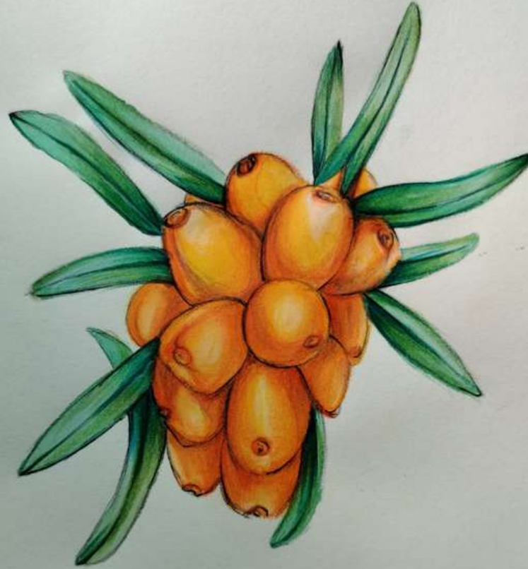
सीबकथोर्न बेरी | शीतांश सयाल द्वारा कलाकृति।

इस सुनहरे अमृत दाने का उपयोग घाव को भरने, सनबर्न में ठंडक प्रदान करने और उम्र के निशान मिटाने